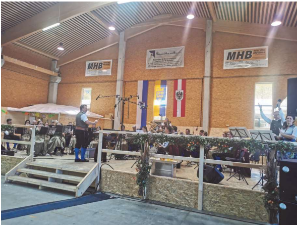
Oktoberfest in Waidhofen/Ybbs