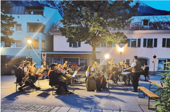
Platzkonzerte im Ort

Ein Musikerleben ohne Ausrückungen ist nicht lustig. Trotz weniger Ausrückungen, konnten wir in dieser nicht so einfachen Zeit einige musikalische Höhepunkte setzen und der Spaß kam somit niemals zu kurz.